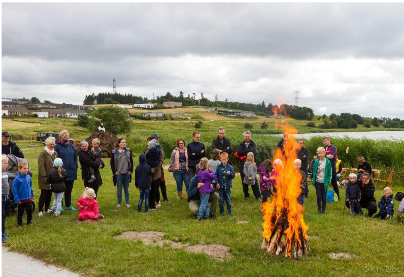
Sankt Hans ved Rødding Sø – i år med børnebål og forskellige lege og spil

Det budskab kan vi i Lokalrådet jo kun bakke op om; kun ved at vi samles og arbejder sammen vil vi få det lokalsamfund, som vi gerne vil have.