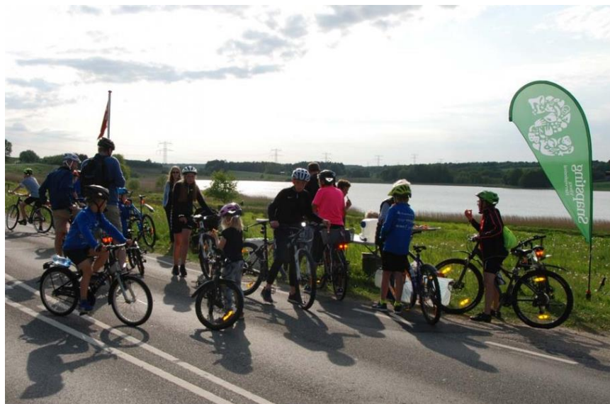
Lokaldysten – 18. maj 2018