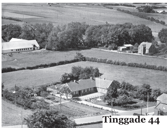
På den anden side af vejen