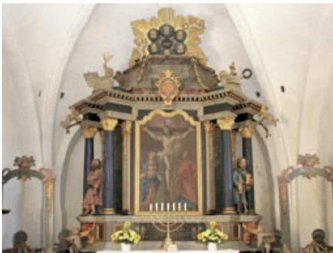
Alteret i Rødding Kirke