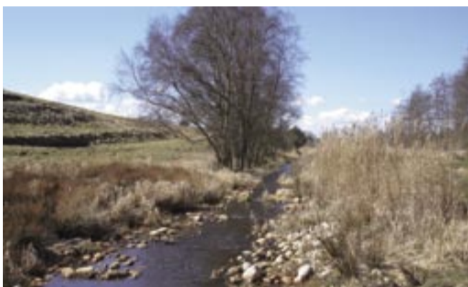
Stenstryg i Nørremølle Å