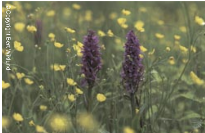
Engen med Maj-Gøgeurt

Hvis du er handicappet, kan du følge den faste sti i søens østlige og nordlige ende. Der er toilet i den lille grønne bygning.