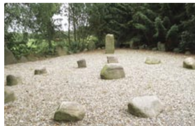
Bystævnet i Batum