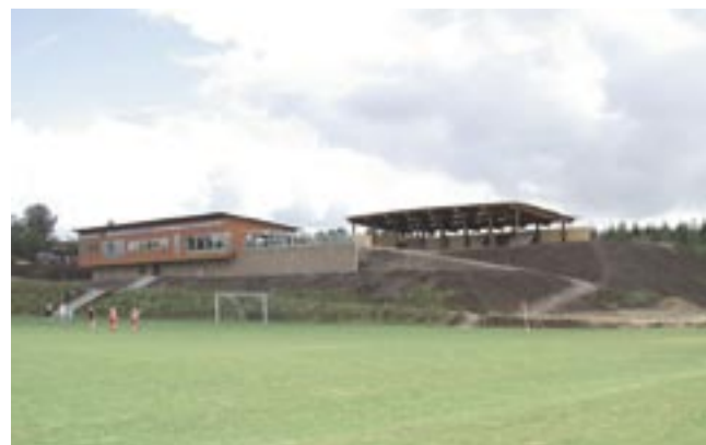
Rødding Kultur- og fritidscenter under opførelse

Her kan du komme og spise din medbragte mad, eventuelt varme dig ved masseovnen og se på aktiviteter i de åbne værksteder.