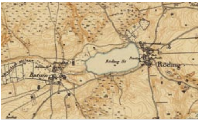
Kort fra 1878

I 2004 blev Rødding Sø genskabt gennem et naturgenopretningsprojekt – et såkaldt vådområdeprojekt. Hovedformålet var at begrænse tilførslen af næringsstoffet kvælstof til de dybere søer i Nørremølle Å-systemet, især Viborg Søerne. Op til projektets start blev det meste af området ikke længere brugt som omdrifts jord, men som græsningsarealer.