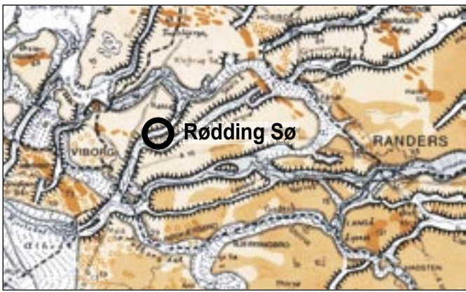
Geologisk kort med dalsystemet med Rødding Sø