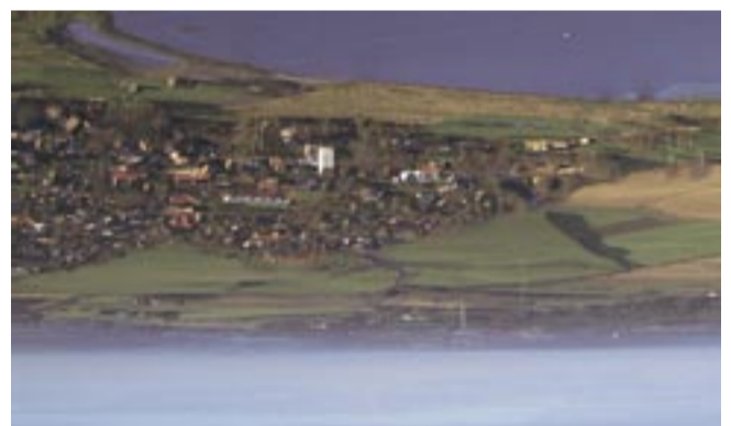
Rødding Sø og by set mod øst