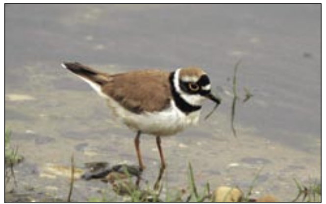
Den Lille Præstekrave, der i 2005 yngede ved søen