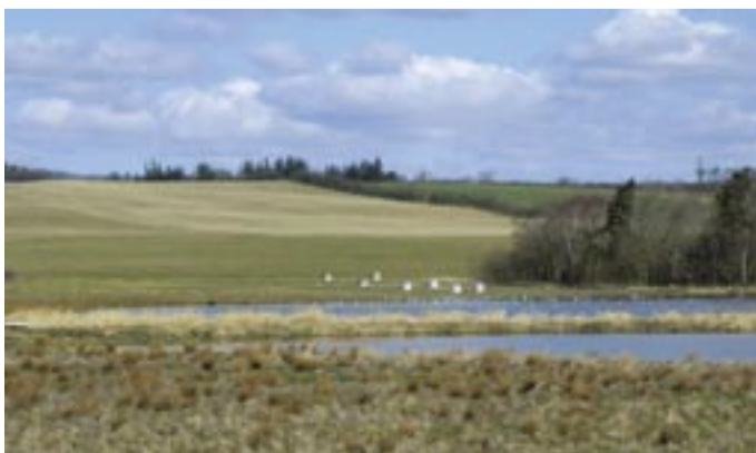
Vandet i engene kontrolleres her i brøndringene